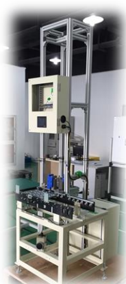
◆各種画像検査装置